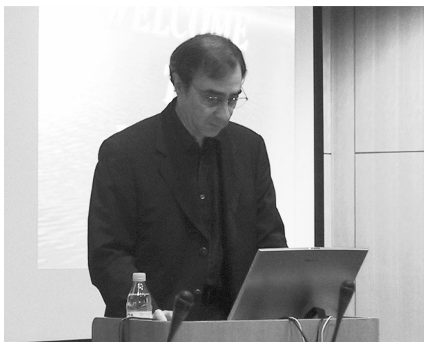
図1 Slater 教授

12月6日の招待講演：「Real People Interacting with Virtually Real People: Some Experiment」は University College London の Mel Slater 教授 (図1) によるものであった。