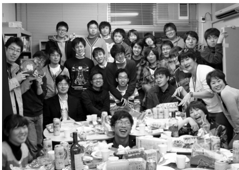
2010 年度送別会の様子