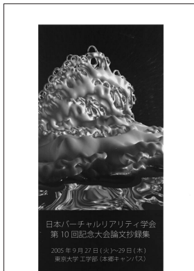
第10回記念大会論文抄録集

来ていましたので、今回はそれをさらに発展させる形で、なるべく見やすく・分かりやすくなるよう心がけてデザインいたしました。また、出版にかかる費用をなるべく抑えるために、抄録集は印刷のみ、CD-ROMに関してもプレスだけを各業者さんにお願ひし、InDesignなどのソフトを用いることにより、すべて自前で編集・データ作成等を行いました。当初は、スクリプト等を駆使して自動化を進めればそれほど手間ではないだろうと考えていたのですが、実際に作業をはじめると発表件数がやはりそれなりにあるため、簡単には進まない箇所もあり、作業している最中には見通しが少し甘かったのではと反省したりもしました。しかし、終わってしまえば、完成した喜びの方が大きく、出版という形で今回の大会の運営に微力ながらも関わられたことを大変うれしく思っています。