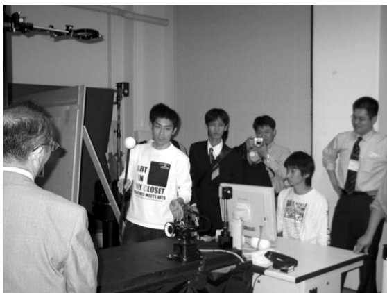
ラボツアーの様子

最後になりますが、多忙な中をご協力頂いた研究室の先生方と学生方、大会長の館先生をはじめとする大会実行委員の皆様方、ツアー会場に足を運んで頂いた参加者の皆様方に、心よりお礼を申し上げます。